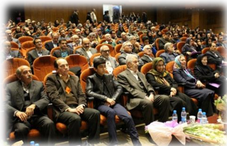
تصویر ۱- مراسم نکوداشت پروفسور حسن ابراهیم زاده معبود